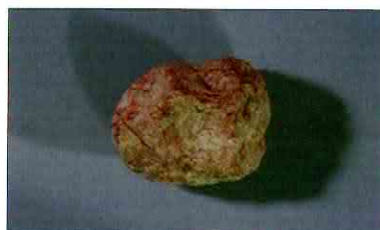
【사진 14】 여러면석기