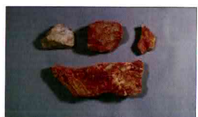
【사진 12】 석기일괄