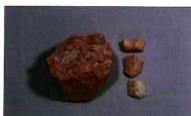
【사진 23】 석기일괄