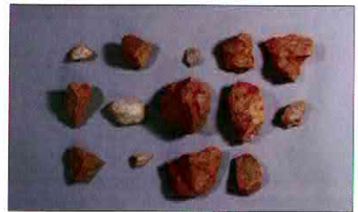
【사진 3】 석기일괄