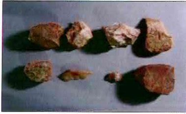
【사진 1】 석기일괄