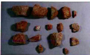
【사진 5】 석기일괄