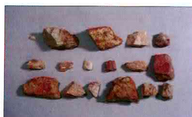
【사진 18】 석기일괄