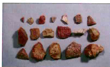
【사진 19】 석기일괄