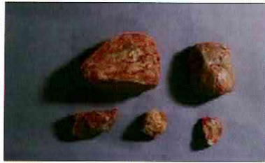
【사진 2】 석기일괄