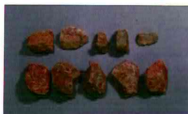
【사진 22】 석기일괄