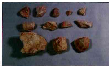
【사진 8】 석기일괄