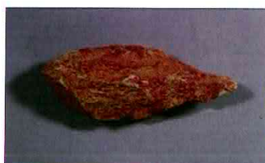
【사진 11】 주먹도끼