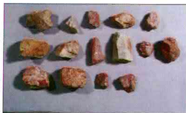
【사진 16】 석기일괄