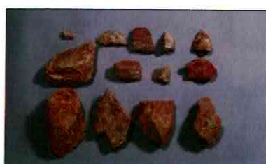
【사진 20】 석기일괄