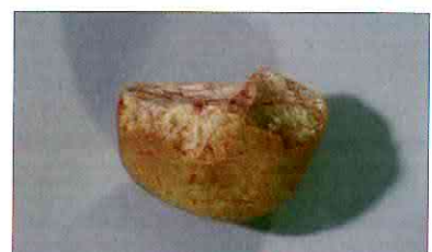
【사진 15】 찌개