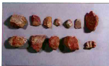
【사진 17】 석기일괄