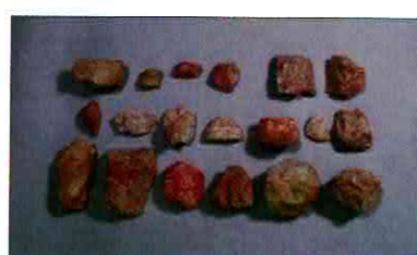
【사진 21】 석기일괄