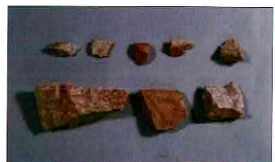
【사진 9】 석기일괄