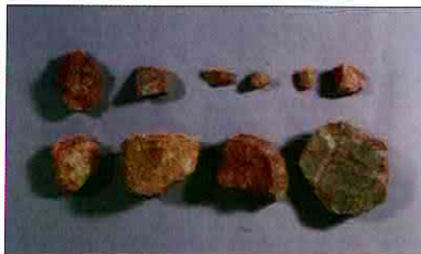
【사진 7】 석기일괄