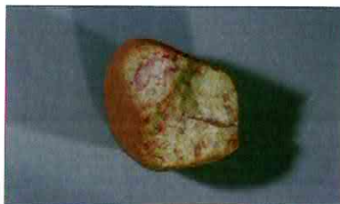
【사진 13】 몸돌