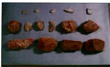
【사진 10】 석기일괄