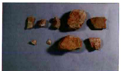
【사진 6】 석기일괄